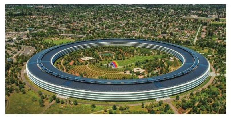
Apple Park, Cupertino, USA